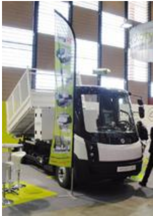
Carrosseries amovibles Carg'Up