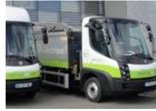
Benne à déchets