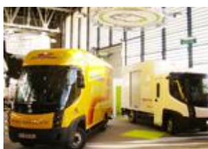
Fourgons Guisnel et Veolia