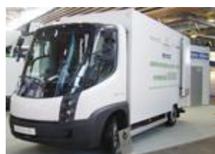
Fourgon 5,5 tonnes