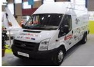
Van 3,5 tonnes